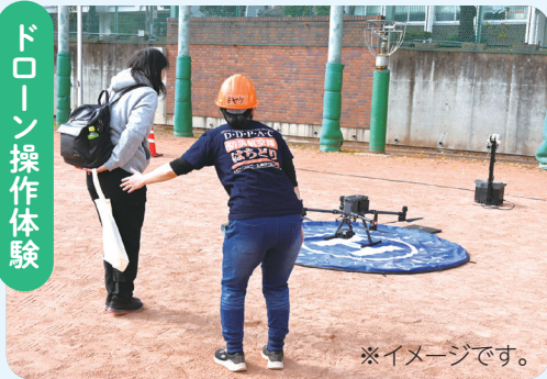
ドローン操作体験