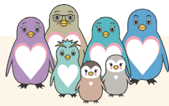
東京都里親制度PRキャラクター「さとべん・ファミリー」