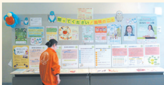
同パネル展の様子