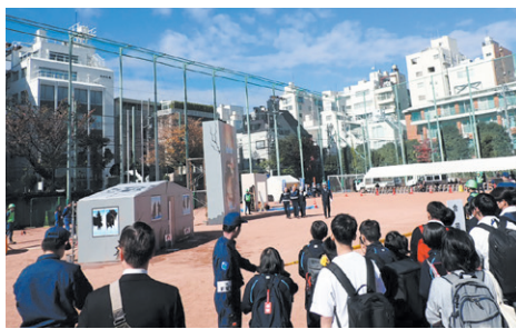
昨年(2024年)の新宿区総合防災訓練の様子

昨年の新宿区総合防災訓練の様子。昨年は、区民の皆さんと一緒にご参加いただき、大変盛り上がりました。今年も、区民の皆さんと一緒にご参加いただき、防災意識を高め、災害に備える機会としたいと思います。